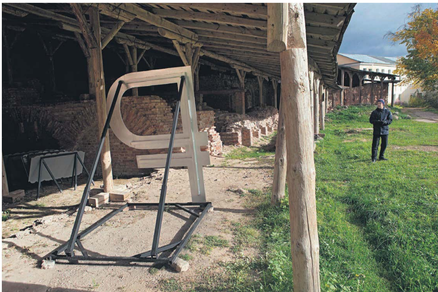
Обратной стороной тревожащего всех в августе ослабления национальной валюты эксперты видят больший рост ВВП и зарплат

Предположение о том, что слабость рубля вызвана будущими скрытыми проблемами федерального бюджета, аналитиками не разделяется: за два месяца они понизили ожидания его дефицита и на 2023-й, и на 2024 год. Оценки динамики импорта и экспорта остались, по сути, неизменными, тогда как прогнозы фактических цен на экспортную нефть РФ выросли. Эксперты также верят в более высокую динамику ВВП РФ 2023 года — 2,2% против предыдущих прогнозов