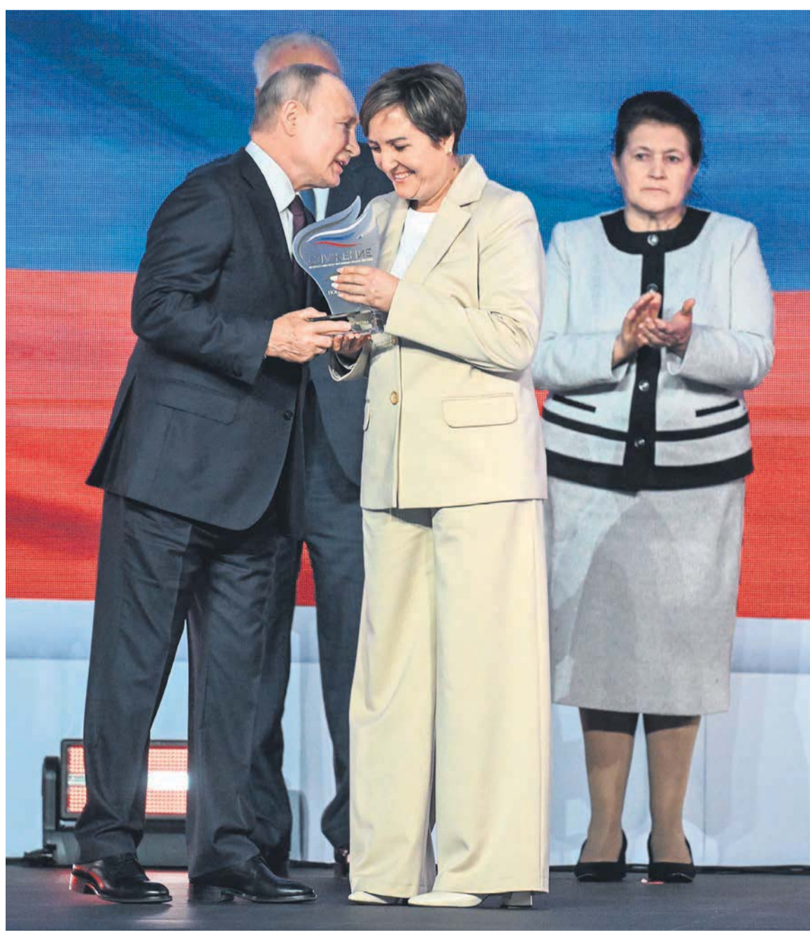
Владимир Путин вручает премию в главной номинации

И между прочим, они мне нравились. Эти люди были как-то по-