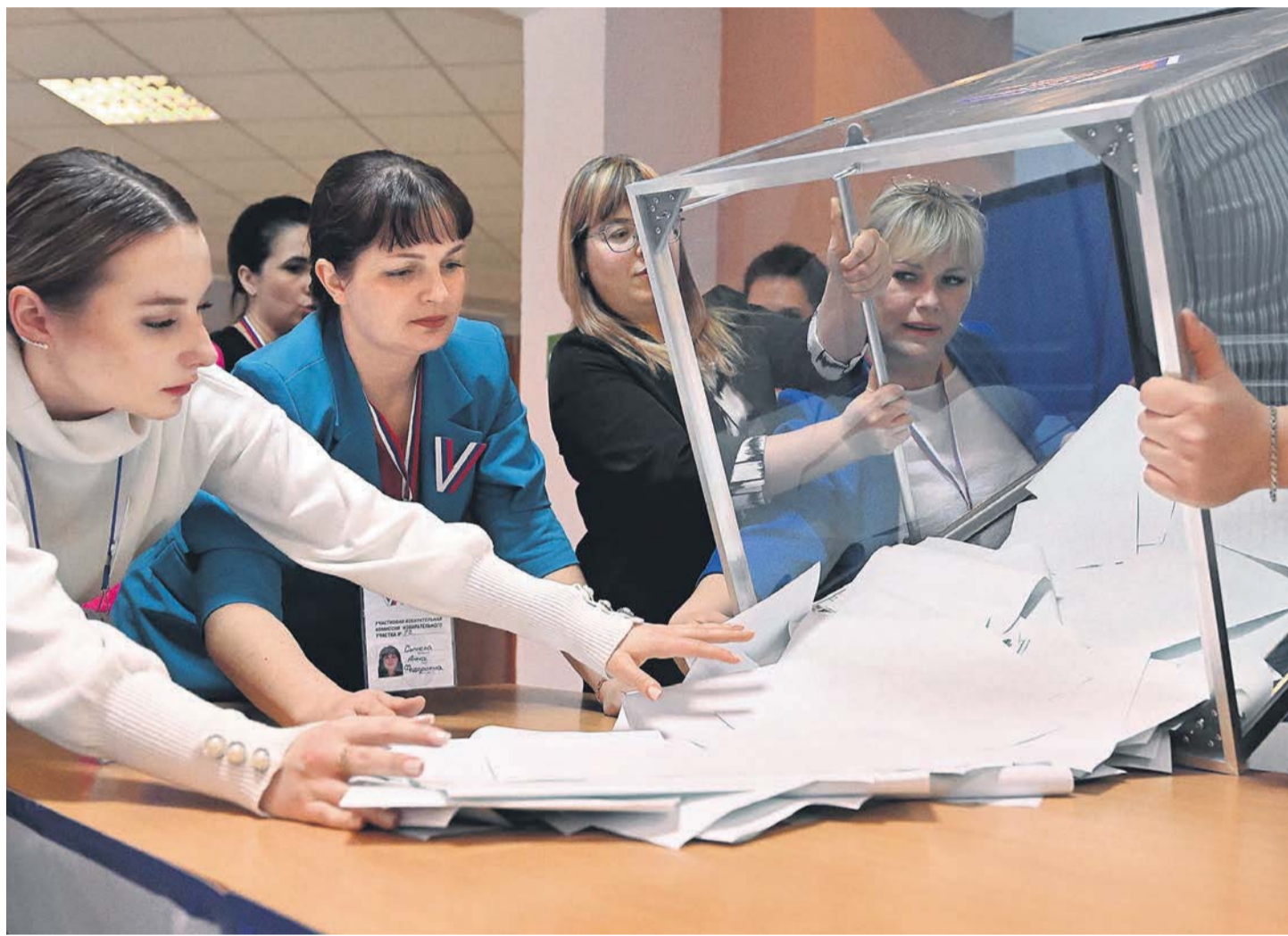
Судья по предварительным подсчетам бюллетеней, российские избиратели проявили повышенную активность и почти 90% из них отдали голоса за действующего президента